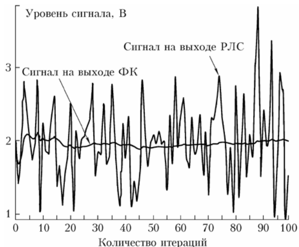
Рис. 1. График сходимости фильтра Калмана при однократной реализации для коэффициента поляризационной анизотропии