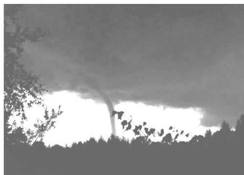
Рис. 1. Смерч над Ладожским озером

ского поляризационного радиолокатора ДМРЛ-С, работающего на длине волны \lambda = 5,3 см, и данные о частоте разрядов по измерениям грозопеленгационной системы Blitzortung.